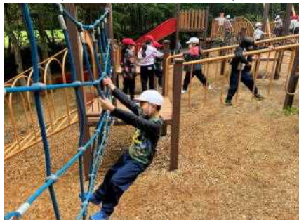
5日 国営アルプスあづみの公園