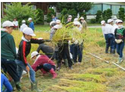
4日 学校西側の水田