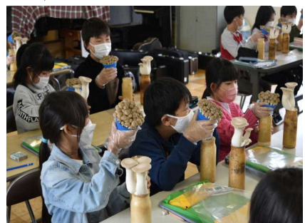
13日 ホクトさんの出前授業